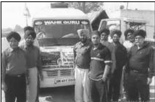
ਸਿੱਖ ਮਿਸ਼ਨਰੀ ਕਾਲਜ (ਰਜਿ:) ਸਰਕਲ ਪਾਨੀਪਤ ਦੇ ਵੀਰ 10 ਮਾਰਚ ਨੂੰ ਅਨੰਦਪੁਰ ਸਾਹਿਬ ਵਿਖੇ ਲੱਗੇ ਕੈਂਪ ਵਿਚ 20 ਮੈਂਬਰਾਂ ਨੇ ਖੂਨਦਾਨ ਕੀਤਾ।

ਸਰਕਲ ਬਿਲਾਸਪੁਰ, ਰਾਏਗੜ੍ਹ ਅਤੇ ਕਵਰਧਾ ਛਤੀਸਗੜ੍ਹ ਜ਼ੋਨ ਵਲੋਂ ਸ੍ਰੀ ਗੁਰੂ ਸਿੰਘ ਸਭਾਵਾਂ ਵਿਚ ਲਿਟਰੇਚਰ ਸਟਾਲ, ਫਰੀ ਲਿਟਰੇਚਰ ਫੰਡ, ਮੈਗਜ਼ੀਨ ਸਿੱਖ ਫੁਲਵਾੜੀ